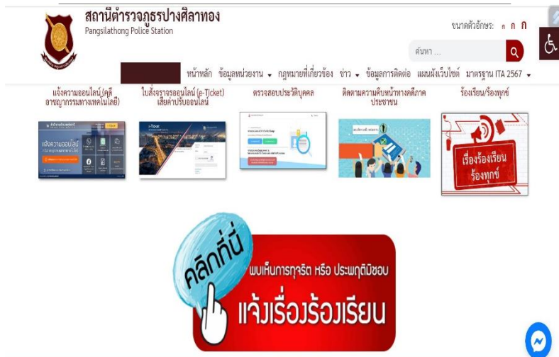
ภาพแสดงช่องทางการร้องเรียนการทุจริตทาง Website ของสถานีตำรวจภูธรปางศิลาทอง