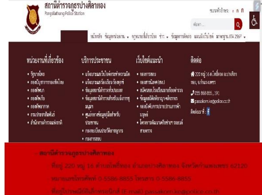
ภาพแสดงช่องทางการร้องเรียนทาง Website ของสถานีตำรวจภูธรปางศิลาทอง