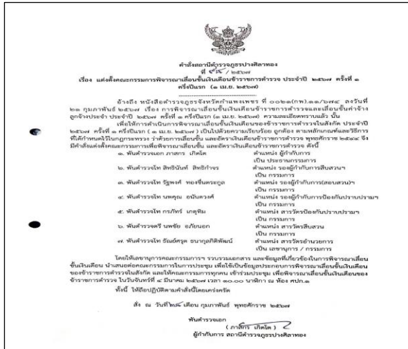
ภาพแสดงคำสั่งแต่งตั้งคณะกรรมการพิจารณาเลื่อนขั้นเงินเดือนของ สก.ปangศิลาทอง